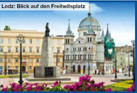
Lodz: Blick auf den Freiheitsplatz