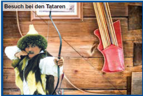
Besuch bei den Tataren