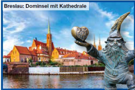
Breslau: Dominsel mit Kathedrale

8.Tag Schlesische Städteschönheit – Auf Entdeckungstour in Breslau Heute genießen Sie einen ganzen Tag in Breslau, der historischen Hauptstadt Schlesiens. Sie entdecken dieses schicke Kleinod zuerst bei einer Besichtigung mit einem örtlichen deutschsprachigen Stadtführer und besuchen u. a. die Dominsel mit der prächtigen Kathedrale (Eintritt inklusive)! Vor Abendessen und Übernachtung in Ihrem Hotel haben Sie am Nachmittag noch Zeit für eigene Entdeckungen.