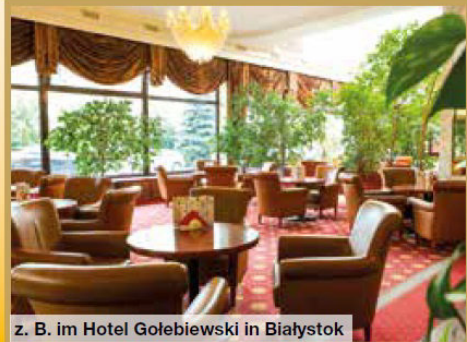
z. B. im Hotel Golebiewski in Białystok