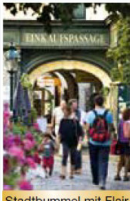
Stadtbummel mit Flair

Mit dem Fernreisebus fahren Sie heute nach Wien, wo Sie Ihr 4*-Hotel erwartet. Wir empfehlen Ihnen, vor Ort ein 2 x Abendessen umfassendes Paket zu buchen, das mit Erlebnissen wie Einkehr in einem „Heurigen“ und Prater-Besuch mit Riesenradfahrt gewürzt ist.